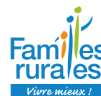
Le Mouvement Familles Rurales : les fédérations nationale, régionale et l'ensemble des associations locales du Morbihan